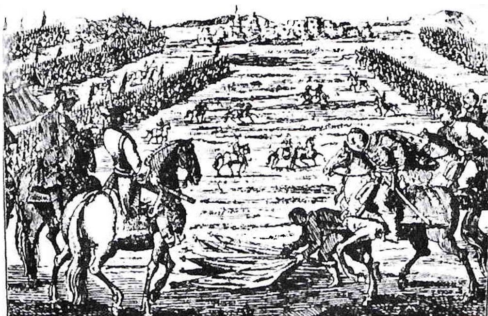
A majtényi zászlóletétel

„A Nagymajtényi síkon letörött a zászló” — így kezdődik egy régi közismert dal. Itt történt? — pontosítsunk. A középkori dokumentumokban Majtény neve