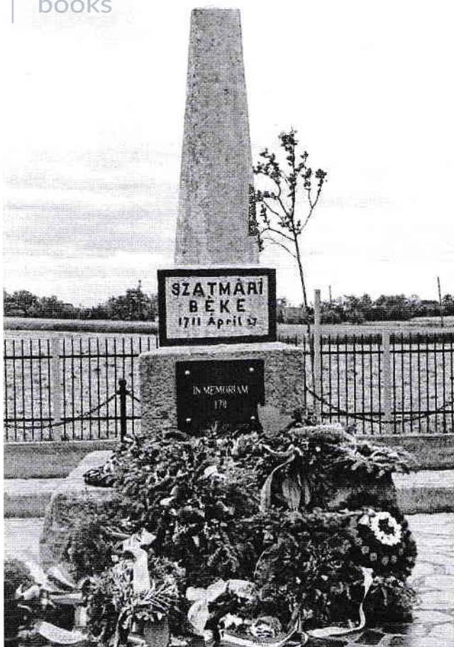
A 2024-ben felújított emlékoszlop

Mivel a Nagykárolyból Szatmárra vezető főút a szóban forgó helytől pár kilométer távolságra húzódik, az arra utazó idegenek, akik közül talán egyeseket érdekelne az emlékhely, semmiféle jelzés nem hívja fel erre a figyelmét. Ezért ajánlatos lenne a főút mellé egy, ezt betájéltó táblát elhelyezni, hiszen azon 300 évvel korábbi eseményeknek amelyeket az itt álló emlékoszlop szimbolizál, a mai kor emberei számára is van pozitív üzenete.